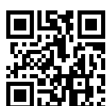
Ersatzhaltestelle Oederan, Markt

Verlassen Sie den Bahnsteig und begeben Sie sich an die Bahnhofstraße. Halten Sie sich rechts und folgen Sie der Bahnhofstraße in die Lange Straße. Folgen Sie dem Straßenverlauf bis zur Freiburger Straße. Biegen Sie dann nach rechts ab um die Ersatzhaltestelle Oederan, Markt zu erreichen. In Richtung Freiberg (Sachs), Dresden wird am Steig 2; in Richtung Flöha, Chemnitz, Zwickau (Sachs) am Steig 3 gehalten.