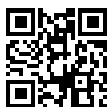
Ersatzhaltestelle Oederan, Bahnhof

Verlassen Sie den Bahnsteig und begeben Sie sich an die Bahnhofstraße. Die Ersatzhaltestelle befindet sich an der Haltestelle Bahnhof.